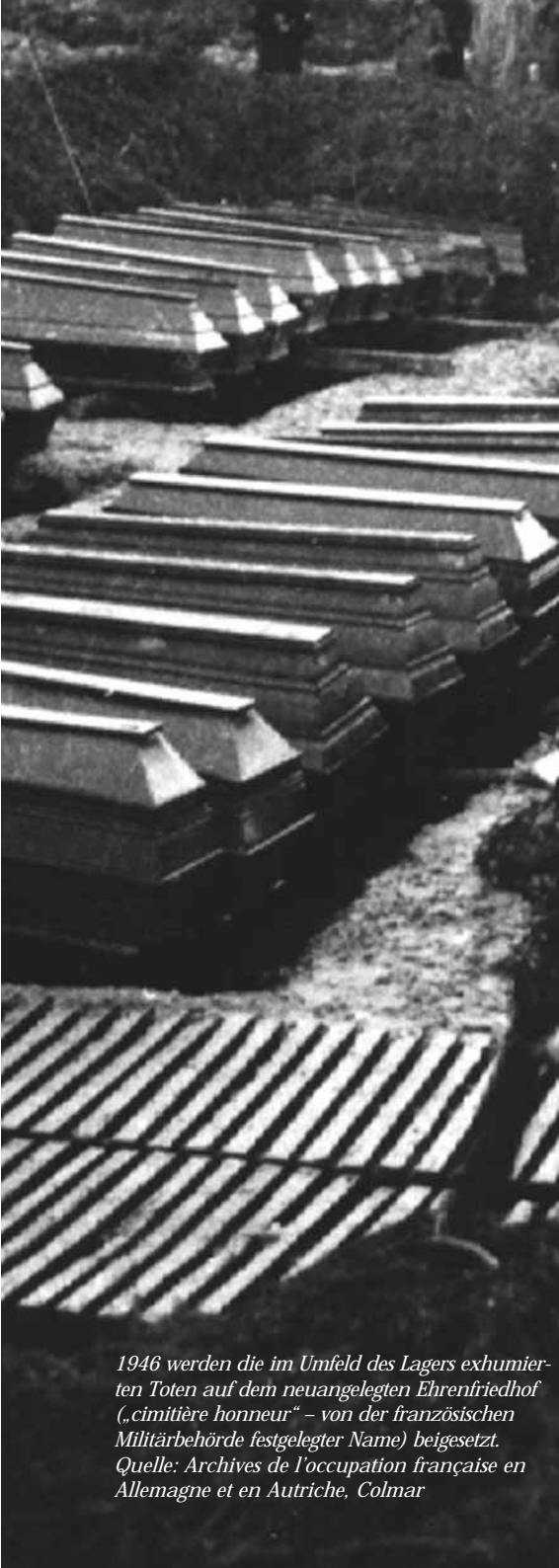
1946 werden die im Umfeld des Lagers exhumierten Toten auf dem neuangelegten Ehrenfriedhof („cimetière honneur“ – von der französischen Militärbehörde festgelegter Name) beigesetzt.

zuzuführen. Grundlage dafür war der so genannte „Kommissarbefehl“. Diesem Befehl Hitlers zufolge sollten politische Offiziere („Kommissare“), die in der Sowjetarmee für die kommunistische Schulung der Soldaten zuständig waren, nach ihrer Gefangennahme ermordet werden.