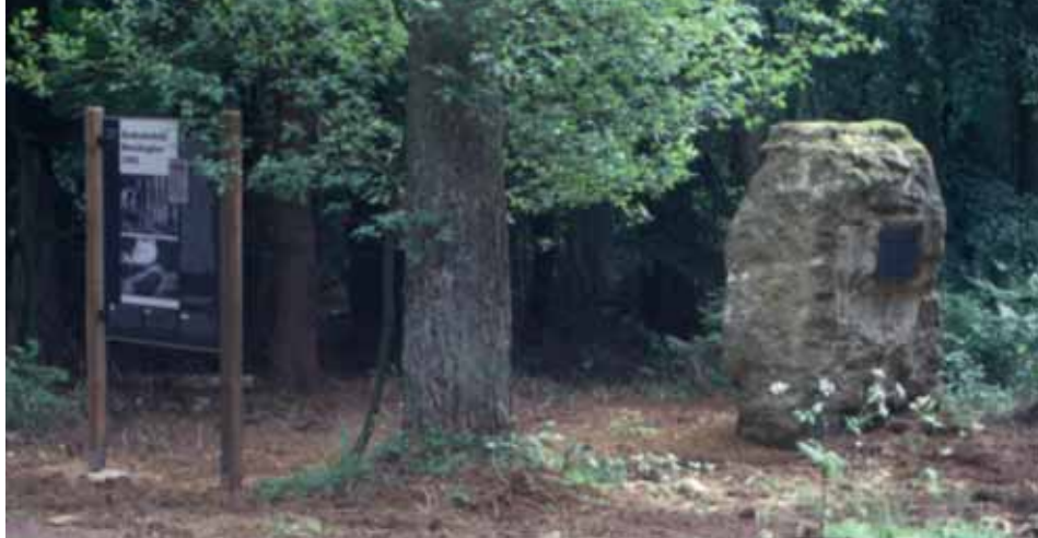
Gedenkstein für die 1942 ermordeten Teilnehmer des Luxemburger Generalstreiks

in Berlin vorgelegt, welches entschied, dass die 25 Luxemburger sofort zu erschießen seien.