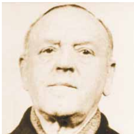
Lagerkommandant Hermann Pister nach seiner Verhaftung

als „Arbeitserziehungslager“ für am Westwall eingesetzte, im nationalsozialistischen Sinne straffällig gewordene, Arbeiter der Organisation Todt (OT) errichtet. Während des Zweiten Weltkrieges entwickelte es sich zu einem Konzentrationslager für Deportierte aus zahlreichen von der Wehrmacht besetzten Ländern. Aufgrund der verschiedenen Sonderfunktionen, die dem Lager im Laufe der Zeit übertragen wurden, blieb es bei der Bezeichnung „SS-Sonderlager“, obwohl es vom Wirtschafts- und Verwaltungsamt ab 1942 wie ein Konzentrationslager geführt wurde. Insgesamt mussten in den sechs Jahren des Bestehens mehr als 13.000 Männer im Lager unter dem Terror der SS leiden.