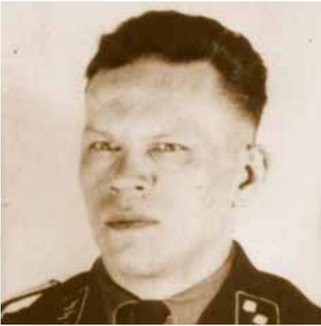
Lagerkommandant Egon Zill