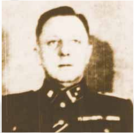
Lagerkommandant Paul Sporrenberg

de. Eine weitere „Aufwertung“ in dem KZ-System erfuhr das Lager am 7. Februar 1942 durch die Zuordnung zum Wirtschafts- und Verwaltungshauptamt der SS (WVHA). Dies fiel noch in die Zuständigkeit Zills, der im April 1942 als stellvertretender Kommandant zum KZ Natzweiler im Elsass versetzt wurde. Als dritter Kommandant des Lagers Hinzert folgte ihm Paul Sporrenberg. Formal behielt das SS-Sonderlager/KZ Hinzert seine Eigenständigkeit, bis es am 21. November 1944 dem Konzentrationslager Buchenwald zugeordnet wurde.