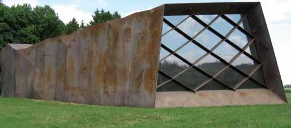
Außenansicht des Dokumentations- und Begegnungshauses

In der Mitte des Ausstellungsraumes steht ein Projektionswürfel für Informationen grundlegender Art, die mittels eines Beamers von der Decke auf den Würfel übertragen werden. Hier sind Informationsfilme zum Lager zu sehen, aber auch elektronische Karten zur Stellung des SS-Sonderlagers im nationalsozialistischen KZ-System abrufbar. Außerdem kann man sich anhand historischer Fotos einen Eindruck vom Barackenlager der Häftlinge machen. Der Blick der Besucher/innen beim Betreten des Ausstellungsraumes wird dann auf das große Fenster fallen, das