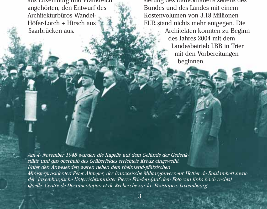
Am 4. November 1948 wurden die Kapelle auf dem Gelände der Gedenkstätte und das oberhalb des Gräberfeldes errichtete Kreuz eingeweiht. Unter den Anwesenden waren neben dem rheinland-pfälzischen Ministerpräsidenten Peter Altmeier, der französische Militärgouverneur Héttier de Bois Lambert sowie der luxemburgische Unterrichtsminister Pierre Frieden (auf dem Foto von links nach rechts)

Mit ihrem Entwurf verfolgten die leitenden Architekten Prof. Wolfgang Lorch und Nikolaus Hirsch den Grundgedanken, die Ambivalenz von heutiger Idylle und vergangenen Verbrechen zum Thema zu machen. Sie wollten ein Gebäude entstehen lassen, „das als Verwerfung der Landschaft deutlich macht, dass die Idylle an diesem Ort trügt“. Mit dem Bau wollen sie „ein Zeichen einer Irritation“ setzen. Die in das Gebäude zu integrierende Ausstellung sollte durch Sichtbezug zum Gelände des ehemaligen Häftlingslagers geprägt sein. Dem einstimmigen Votum der Jury stimmten die Landesregierung und die Landtagsfraktionen zu. Das Projekt wurde auch von der Bundesbeauftragten für Kultur und Medien anerkannt. Der gemeinsamen Realisierung des Bauvorhabens seitens des Bundes und des Landes mit einem Kostenvolumen von 3,18 Millionen EUR stand nichts mehr entgegen. Die Architekten konnten zu Beginn des Jahres 2004 mit dem Landesbetrieb LBB in Trier mit den Vorbereitungen beginnen.