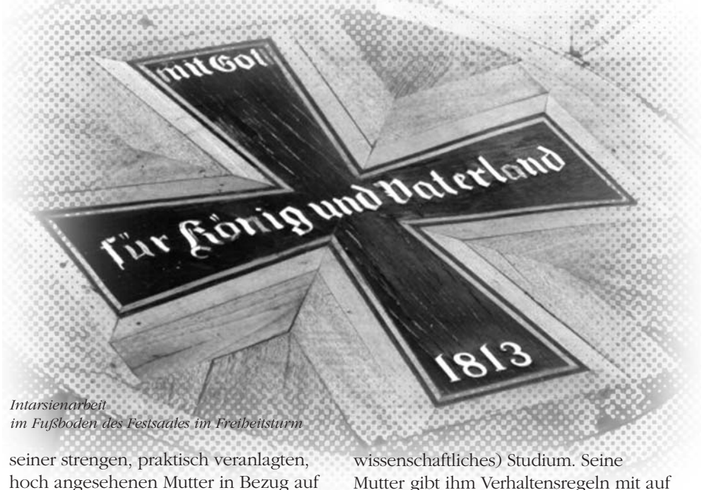
Intarsienarbeit im Fußboden des Festsalles im Freiheitsturn

1773 beginnt Karl Freiherr vom Stein in Göttingen sein Jura-, Geschichts- und kameralwissenschaftliches (= wirtschafts-