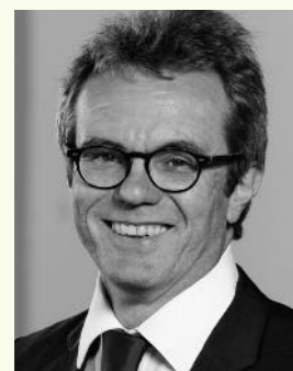
Wolfgang Faller Direktor der Landeszentrale für politische Bildung Rheinland-Pfalz