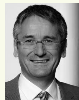
Hendrik Hering Präsident des Landtags Rheinland-Pfalz

Zeiten des Umbruchs in Vergangenheit, Gegenwart und Zukunft - diese können bei den drei Themen des Schüler- und Jugendwettbewerb 2017 bearbeitet werden: Mitgedacht – mitgemacht! Wir freuen uns auf Eure Beiträge.